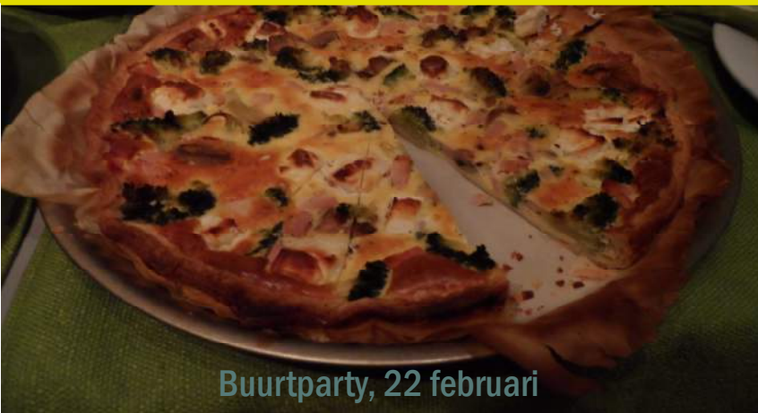
Buurtparty, 22 februari