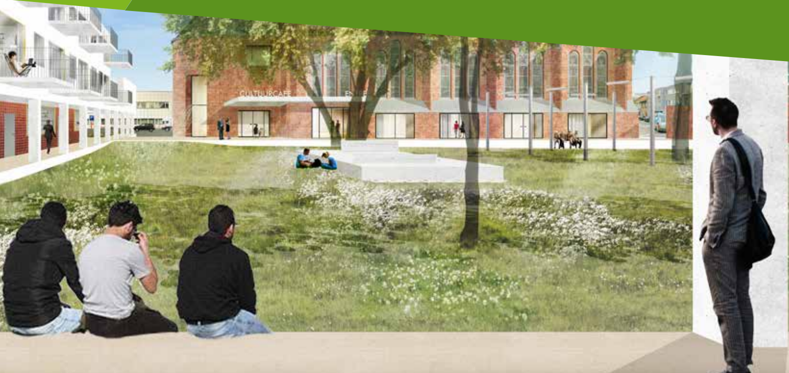
Zicht op toekomstige tuin Paterskerk

BUURTWERK ELISABETHWIJK | NUMMER 19 | HERFST 2018